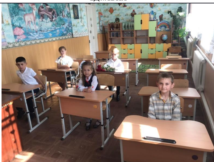
НУШ 2 клас