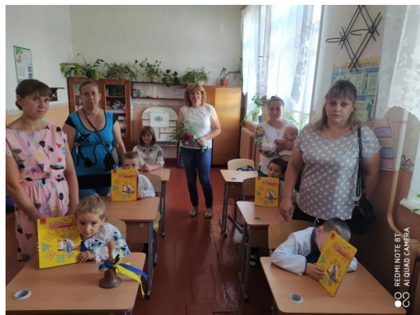
НУШ 4 клас