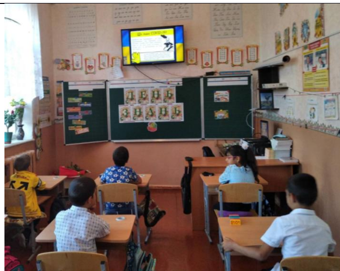
НУШ 1 клас